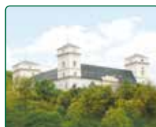
Zámek Račice, Račice-Pístovice - hl. budova