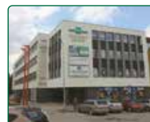
eFi Obchodní Galerie, byty a kanceláře - Jihlava