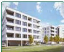
Bytové domy Břeclav, ul. Charvátská