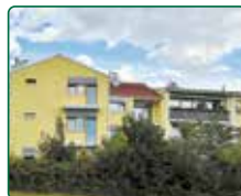
Bytový dům, Brno, ul. Holzova