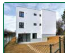
Rezidence Bílovice, Bílovice nad Svitavou

Již 22 let investujete s e-Finance, a.s.