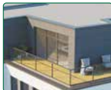
eFi Obchodní Galerie, byty a kanceláře, Jihlava - nástavba