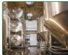
EFI Pivovar, Brno