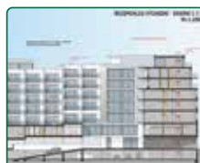
eFi Palace Hotel, Brno, 3. etapa, přístavba