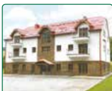
eFi ApartHotel, Horní Lipová, Lipová lázně