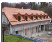
Zámek Račice, Račice-Pístovice - podzámčí