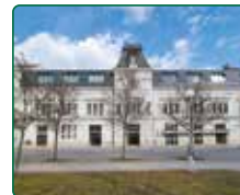
EFI SPA Hotel, Brno, Nám. 28. října