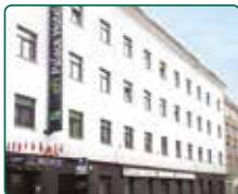
eFi Palace Hotel, Brno, dokončené 2 etapy