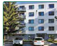
Rezidence Pěkná, Brno, nebytové prostory