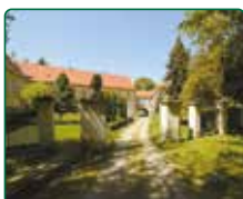
Zámek Račice, Račice-Pístovice - předzámčí