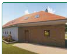
EFI Mlýn, EFI Motorest a rybníky - Hodonín u Kunštátu