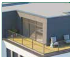
eFi Obchodní Galerie, byty a kanceláře, Jihlava - nástavba