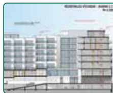
eFi Palace Hotel, Brno, 3. etapa, přístavba