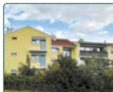
Bytový dům, Brno, ul. Holzova