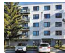
Rezidence Pěkná, Brno, nebytové prostory