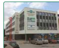
eFi Obchodní Galerie, byty a kanceláře - Jihlava