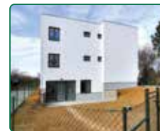
Rezidence Bílovice, Bílovice nad Svitavou

Již 22 let investujete s e-Finance, a.s.