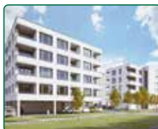
Bytové domy Břeclav, ul. Charvátská