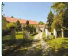
Zámek Račice, Račice-Pístovice - předzámčí