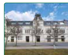
EFI SPA Hotel, Brno, Nám. 28. října