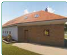
EFI Mlýn, EFI Motorest a rybníky - Hodonín u Kunštátu