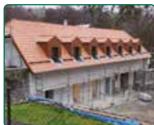
Zámek Račice, Račice-Pístovice - podzámčí