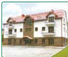
eFi ApartHotel, Horní Lipová, Lipová lázně