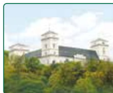
Zámek Račice, Račice-Pístovice - hl. budova