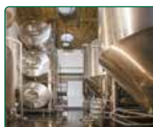
EFI Pivovar, Brno