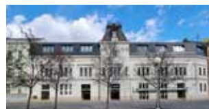
EFI SPA Hotel**** Superior & Pivovar