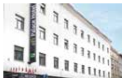
eFi Palace Hotel***

Další projekty e-Finance najdete přímo na webu e-Finance v záložce PORTFOLIO INVESTIC .