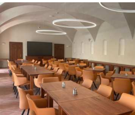
Sál Konírna v Předzámčí

Přidejte se k nám v roce 2024 a zažijte nezapomenutelnou dovolenou plnou luxusu, relaxace a kulturního obohacení na Zámku Račice v Račicích-Pístovicích na Vyškovsku, jen 30 km od Brna!