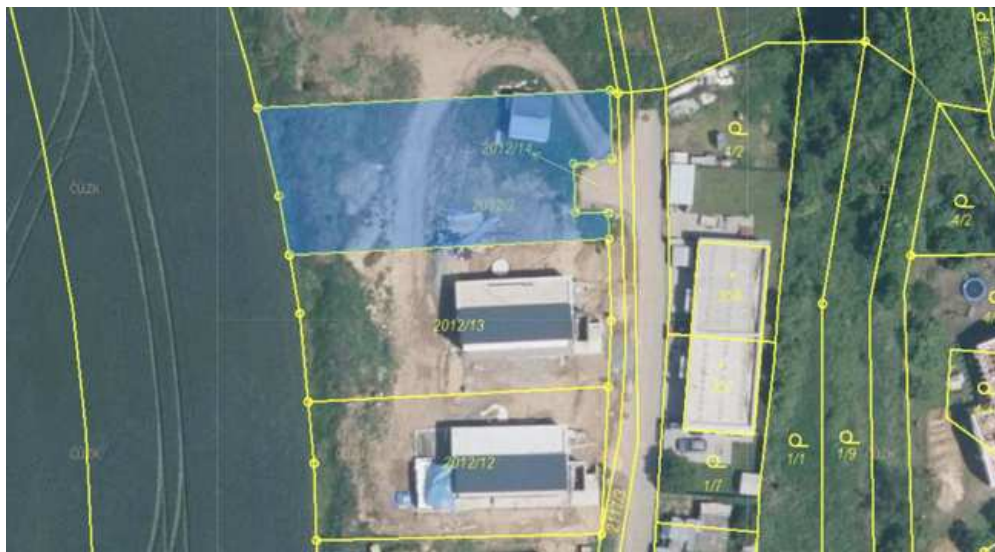
Katastrální mapa pozemku v Tučapech