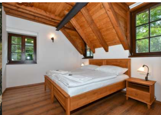
Ubytování v Podzámčí

KONCERN E-FINANCE, A.S. JE INVESTIČNÍ REALITNÍ SKUPINOU PŮSOBÍCÍ NA ČESKÉM TRHU JIŽ OD ROKU 2001. PORTFOLIO DOKONČENÝCH A PRONAJÍMANÝCH NEMOVITOSTÍ SKUPINY E-FINANCE, A.S. DLE ZNALECKÝCH POSUDKŮ JIŽ PŘESAHUJE HODNOTU 1,6 MILIARD KORUN. HODNOTA VŠECH REALITNÍCH PROJEKTŮ VČETNĚ TĚCH, KTERÉ JSOU V PŘÍPRAVĚ A VÝSTAVBĚ, PŘESAHUJE HODNOTU 2,2 MILIARDY KORUN.