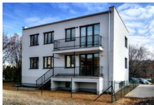
Novostavba se 3 byty, Bílovice n. Svitavou

KONCERN E-FINANCE, A.S. JE INVESTIČNÍ REALITNÍ SKUPINOU PŮSOBÍCÍ NA ČESKÉM TRHU JIŽ OD ROKU 2001. PORTFOLIO DOKONČENÝCH A PRONAJÍMANÝCH NEMOVITOSTÍ SKUPINY E-FINANCE, A.S. DLE ZNALECKÝCH POSUDKŮ JIŽ PŘESAHUJE HODNOTU 1,6 MILIARD KORUN. HODNOTA VŠECH REALITNÍCH PROJEKTŮ VČETNĚ TĚCH, KTERÉ JSOU V PŘÍPRAVĚ A VÝSTAVBĚ, PŘESAHUJE HODNOTU 2,2 MILIARDY KORUN.