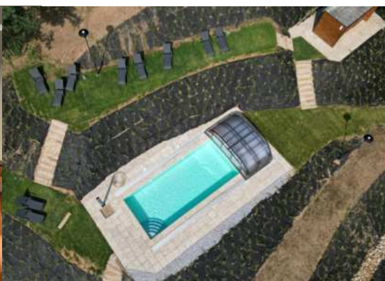
Bazén s terasami v Podzámčí