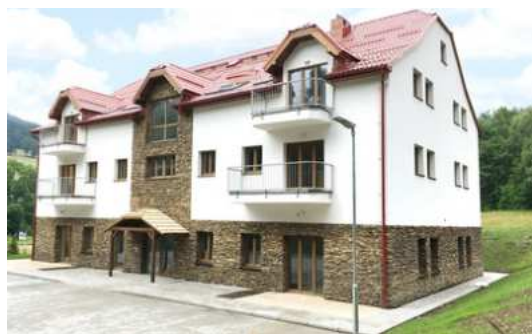
Investiční apartmány v Jeseníkách

Tzn. pokud investiční nemovitost koupíte dnes a prodáte např. za deset let, je pravděpodobné dle historických ukazatelů, že se její cena během těchto deseti let navýší o více než 50 %, spíše se bude blížit dvojnásobné hodnotě. A v tomto mezidobí ještě inkasujete pravidelný nájem.