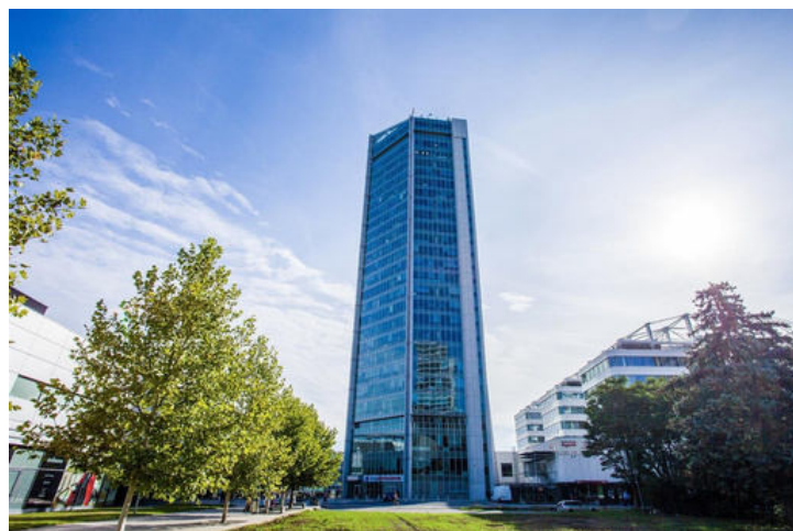
Budova City Empiria, Praha

KONCERN E-FINANCE, A.S. JE INVESTIČNÍ REALITNÍ SKUPINOU PŮSOBÍCÍ NA ČESKÉM TRHU JIŽ OD ROKU 2001. PORTFOLIO DOKONČENÝCH A PRONAJÍMANÝCH NEMOVITOSTÍ SKUPINY E-FINANCE, A.S. DLE ZNALECKÝCH POSUDKŮ JIŽ PŘESAHUJE HODNOTU 1,6 MILIARD KORUN. HODNOTA VŠECH REALITNÍCH PROJEKTŮ VČETNĚ TĚCH, KTERÉ JSOU V PŘÍPRAVĚ A VÝSTAVBĚ, PŘESAHUJE HODNOTU 2,2 MILIARDY KORUN.