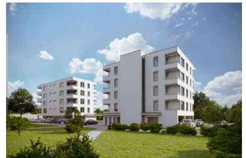
Břeclav - bytové domy