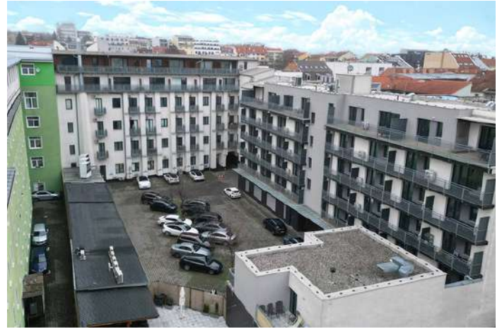
Brno, EFI Palace - vnitroblok s parkingem