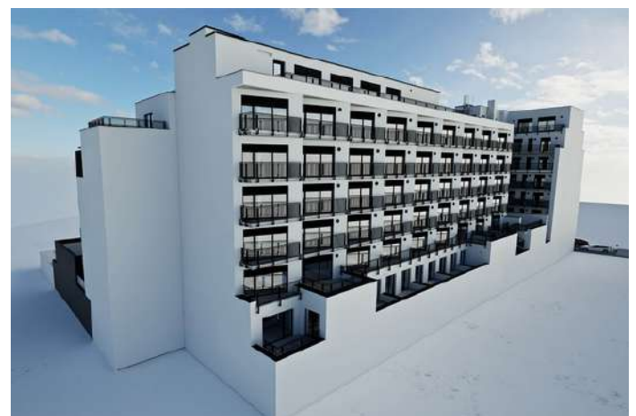
Brno, EFI Palace - 3. etapa - jihovýchodní pohled