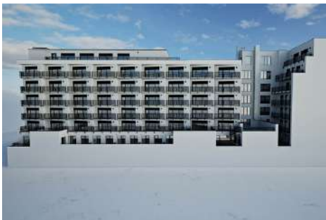
Brno, EFI Palace - 3. etapa