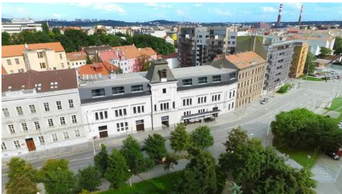
EFI SPA Hotel, pohled z dronu

Další informace najdete na: https://www.efispahotel.cz