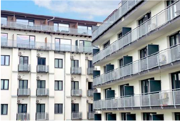
Brno, EFI Palace

Očekávaná hodnota celého areálu po dokončení třetí etapy přesáhne 1,2 mld. Kč. Projekt je koncipován s využitím rozumné finanční páky (kombinace bankovního financování a kapitálu fondu), což vytváří nadprůměrný potenciál pro zhodnocení prostředků investorů. Nemovitost je rozdělena na jednotlivé jednotky, což poskytuje fondu flexibilní exitovou strategii – od postupného rozprodeje bytů a jednotek individuálním investorům až po prodej celého komplexu institucionálnímu investorovi.