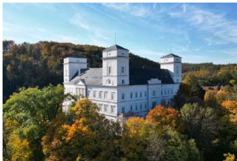
Zámek Račice - hlavní budova / palác