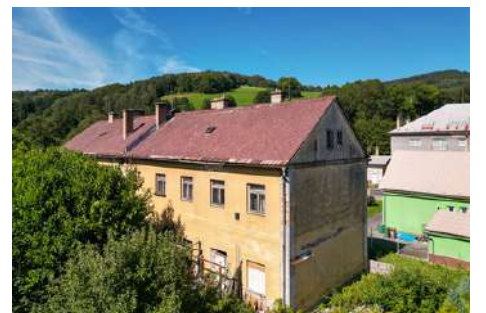
Jeseníky - bytový dům