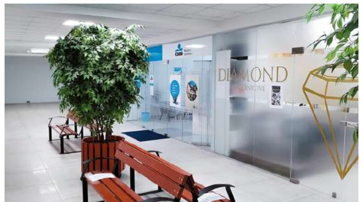
EFI Obchodní galerie - vnitřní prostory