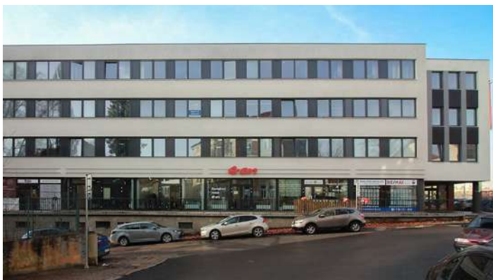
EFI Obchodní galerie - boční pohled

Z pohledu dalšího rozvoje se nabízí také postupná konverze 3. a 4. nadzemního podlaží z kancelářských prostor na rezidenční jednotky, čímž by došlo k posílení bytové složky v atraktivní městské lokalitě s trvale silnou poptávkou po nájemním bydlení. Tato přestavba by umožnila nejen zvýšit výnos z nájemného, ale zároveň vytvořit jednotky vhodné k následnému rozprodeji po jednotlivých bytech.