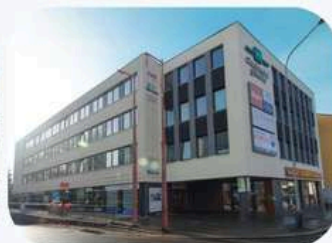
EFI Obchodní Galerie, Jihlava