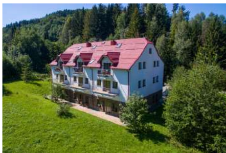
Horní Lipová - EFI ApartHotel II. etapa