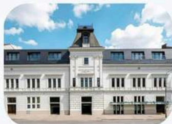
EFI SPA Hotel Superior ****