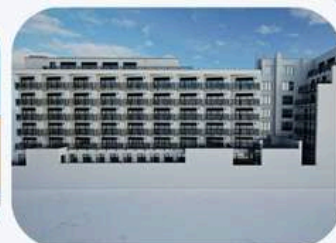
Přístavba EFI Palace, Brno

Toto je propagační sdělení, nejedná se o nabídku ani výzvu k upisování. Investorem se může stát pouze kvalifikovaný investor ve smyslu § 272 zákona č. 240/2013 Sb. Než provedete jakékoli konečné investiční rozhodnutí, přečtěte si, prosím, statut a sdělení klíčových informací fondu (KID), které jsou (v některých případech pouze po přihlášení do klientského vstupu) v českém jazyce k dispozici na www.amista.cz .