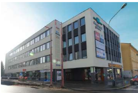
Jihlava, EFI Obchodní Galerie