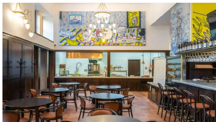
EFI SPA Hotel - restaurace EFI Hostinec Osmec