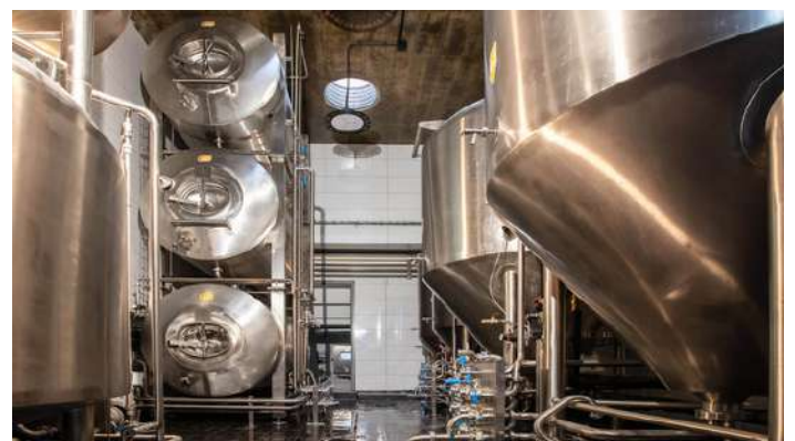
EFI SPA Hotel - ležácký sklep EFI Pivovaru