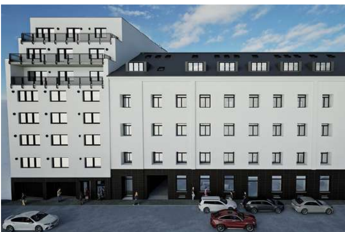
Brno, EFI Palace - 3. etapa - pohled z ulice

Po dokončení třetí etapy bude komplex tvořit 148 nadstandardně vybavených bytů v dispozicích 1+kk až 4+kk, určených primárně pro dlouhodobé pobyty od jednoho měsíce až po několik let. Díky tomu lze dosahovat nadprůměrného nájemného oproti standardnímu rezidenčnímu trhu. Neobsazené byty jsou průběžně zapojovány do hotelového režimu, což dále zvyšuje výnosový potenciál projektu.