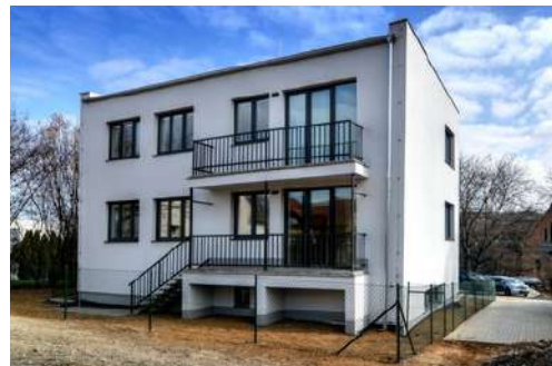
Novostavba se 3 byty, Bílovice n. Svitavou