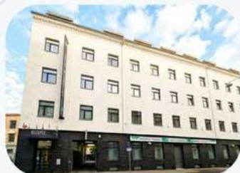
EFI Palace, Brno