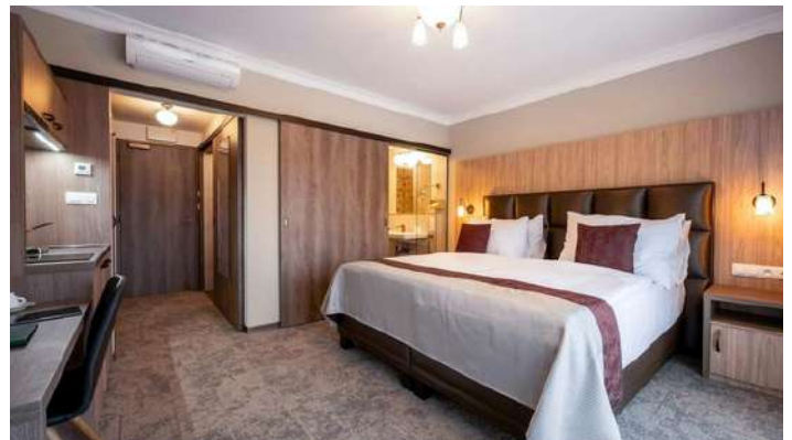
EFI SPA Hotel - apartmán